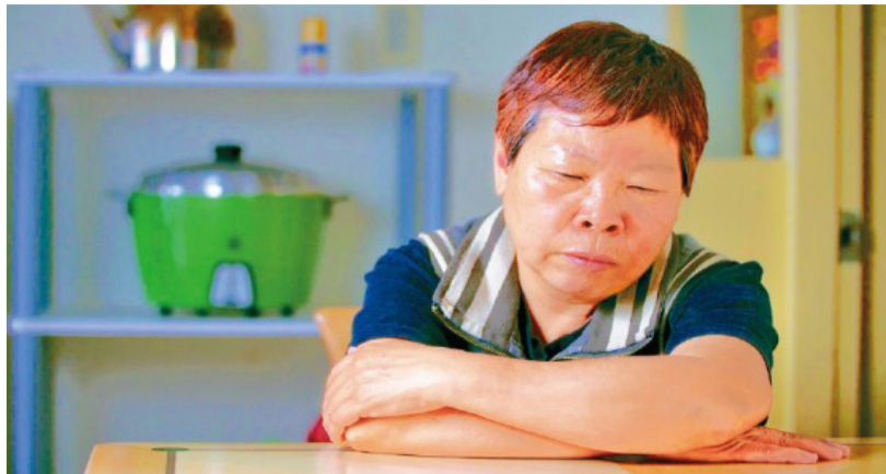
作品《日常對話》拿下第11屆臺灣國際紀錄片影展「臺灣競賽」首獎。

《不即不離》透過追溯馬來西亞的家庭故事，來探尋和挖掘馬來西亞的歷史，背後隱藏的竟是一整個世代不願面對的過去，以及一群曾經付出熱血，卻彷彿消失於世間的人。廖克發表示，在馬來西亞，種族往往被政府當成工具，他希望藉由這部影片可以在馬來亞人的耳邊發出聲音，突破這種界限。