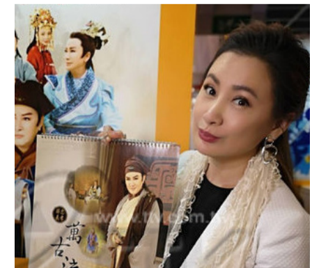
陳亞蘭於香港宣傳歌仔戲。