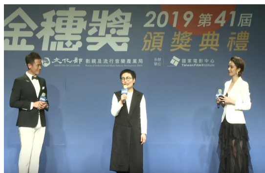
文化部次長丁曉菁(中)致詞。

都能盡快被好人家領養，離開這裡、展開正常人生的故事，而此片也是去年高雄電影節「台灣火球大獎」得主。