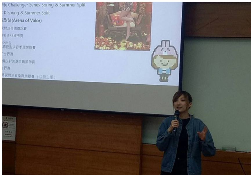
銘傳大學3月29日邀請電競主播瑞比前來分享自身工作經驗。