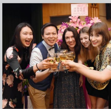
中央廣播電臺俄語主持群舉杯歡慶節目復播25周年。