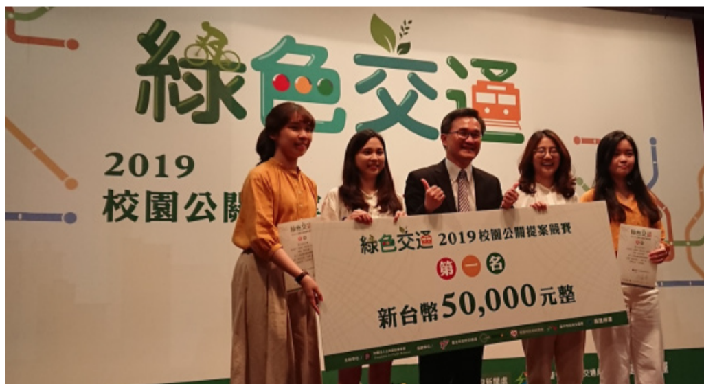
政治大學「欸可以耶！」奪2019校園公關提案競賽冠軍。