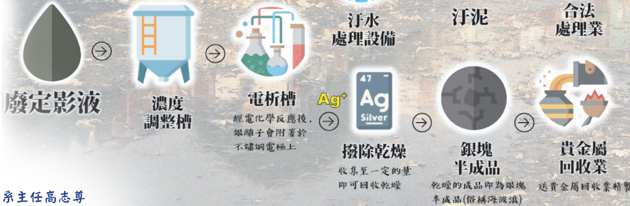
資料來源：工業技術研究院環安中心經理 鄭智和 製圖／陳政諭