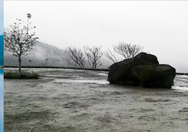
水中央放水