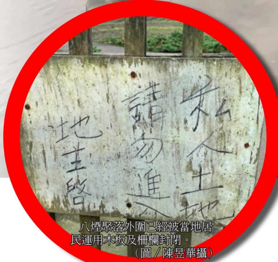
八煙聚落外圍已經被當地居民運用木板及柵欄封閉。（圖／陳昱華攝）