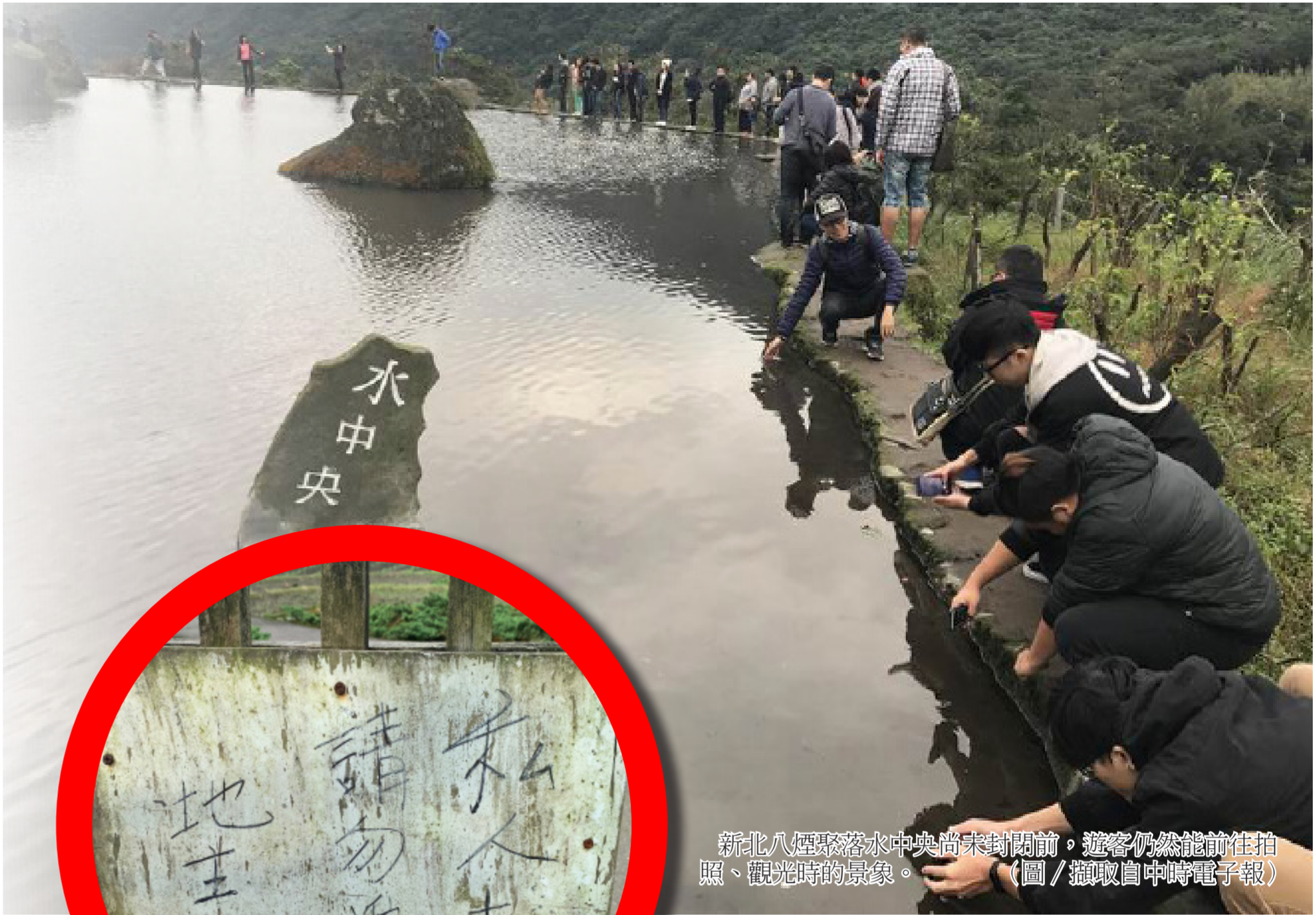
新北八煙聚落水中央尚未封閉前，遊客仍然能前往拍照、觀光時的景象。

此外，觀光效益要實際精確評估較為困難，只能從觀光活動所帶來的周邊效益來看，如住宿率、餐飲消費、伴手禮或紀念品的購買等，不一定要達到怎麼樣的規模，才算有觀光效益。