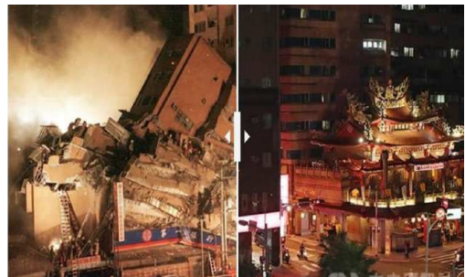
過往的照片檔案對比上今日街景的樣貌。

蘋果日報以揮別傷痛為主軸，專訪兩個受災鄉鎮的災民，他們的生命故事透過每張不同時期的照片串連在一起，從黑白相片到彩色，如同他們從最漆黑的夜晚，迎向重生的曙光。此外，也在蘋果新聞網上企劃《走過921》專題報導災後重生的人物故事與相關影音動新聞。