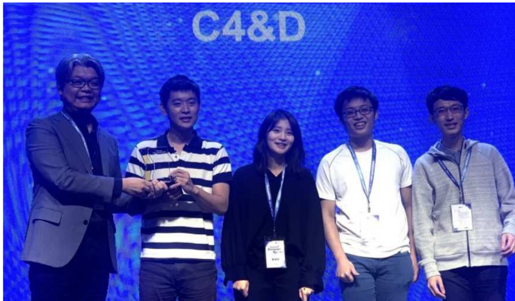
「C4&D」開發的「TRAVEL CHARGER」拿下黑客松競賽評審大獎。