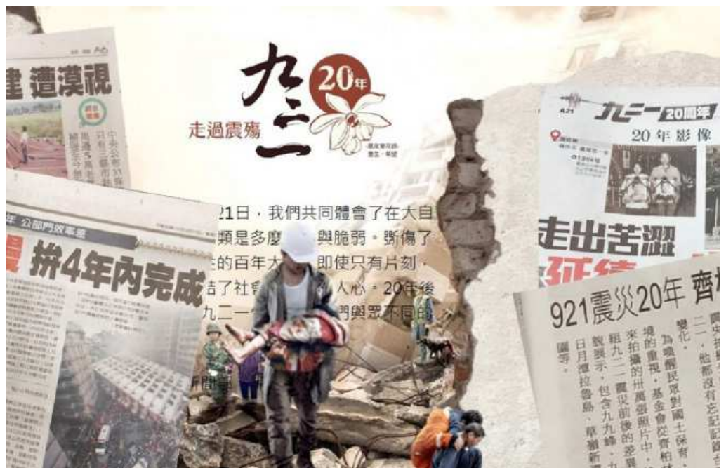
921大地震一路走來20年，各家媒體在網路放上專題報導(製圖／林欣穎)

《報導者》在系列專題中放上受訪者的聲音，透過他們親自敘述，那一晚發生的事，彷彿還歷歷在目。除了人物故事，其中把齊柏林當年在921前後拍攝的照片放入專題，山茂的變化讓人深深體悟到大自然的威力。