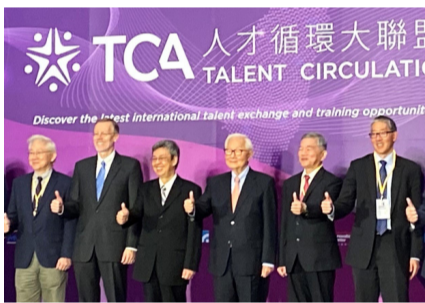
右二起為經濟部長沈榮津、台積電創辦人張忠謀、副總統陳建仁、美國在台協會處長鄺英傑。

鄺英傑表示，美國在台協會提出高峰會四大重點目標。第一點，在現今數位時代重現台灣的成功故事，過去許多台灣領袖人物都是海外學成歸來，將國外獲取的經驗知識帶回國，並在自己的專業領域發光發熱；第二，將著重促進台美間相同理念及經濟體的人才流通，達到雙贏，預防科技專業人才流失；第三為培養人才，國際相當看好台灣人的資質，希望透過交流激發科技人才的創新思維，替產業轉型；第四，台灣應加強與國際私部門、學術圈、非政府組織的人才交流，拓展台灣國際能見度。