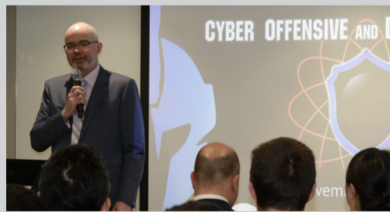
谷立言譴責網路攻擊，破壞民主體制。