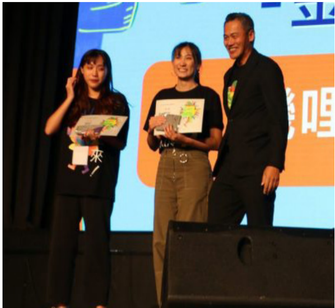
廣銷系勇奪金獎同學。