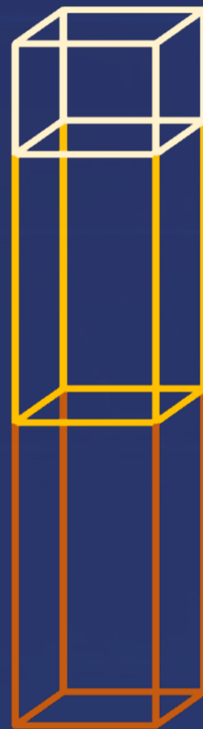
資訊工業策進會服務型機器人市場調查