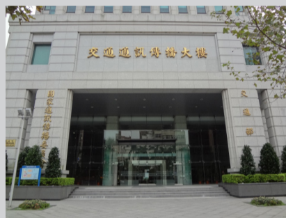
左圖為遭罰之節目畫面；右圖為國家通訊委員會(NCC)大樓。

委員會強調，新聞報導對兒童進行誘導，或以兒童做為政治新聞報導主體，確實有對其身心健康產生影響之虞，應予審慎，以避免觸法。