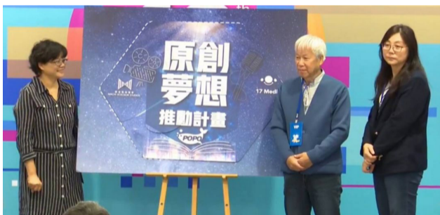
POPO原創與17Media及麻吉砥加電影推出「原創夢想推動計畫」。