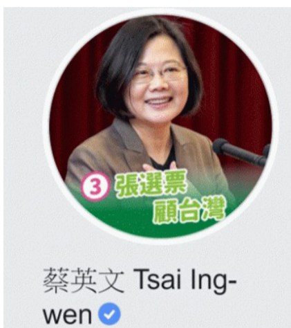
蔡英文 Tsai Ing-wen