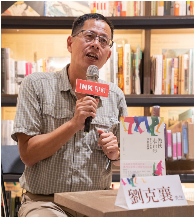
中央通訊社董事長劉克襄。