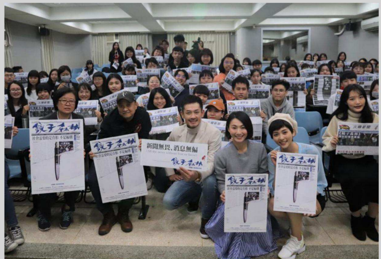
《鏡子森林》劇組到台中朝陽科大校園宣傳。

《鏡子森林》12月1日起民視無線台播出、12月7日起於公共電視及龍華偶像台播出。網路播放平台：四季線上影視、LINE TV、KKTV、FriDay平台加入播映行列。