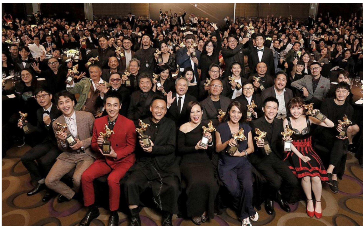
第56屆金馬獎頒獎典禮11月23日於國父紀念館舉行，《返校》、《陽光普照》各拿下五大獎。 (圖／台北金馬影展)