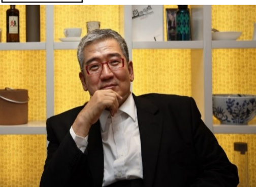
大塊文化董事長郝明義說：「閱讀是他生命中很重要的一部分。」(文/戴瑋)