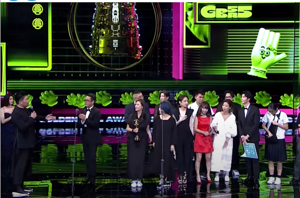
《想見你》工作人員一同上台領獎