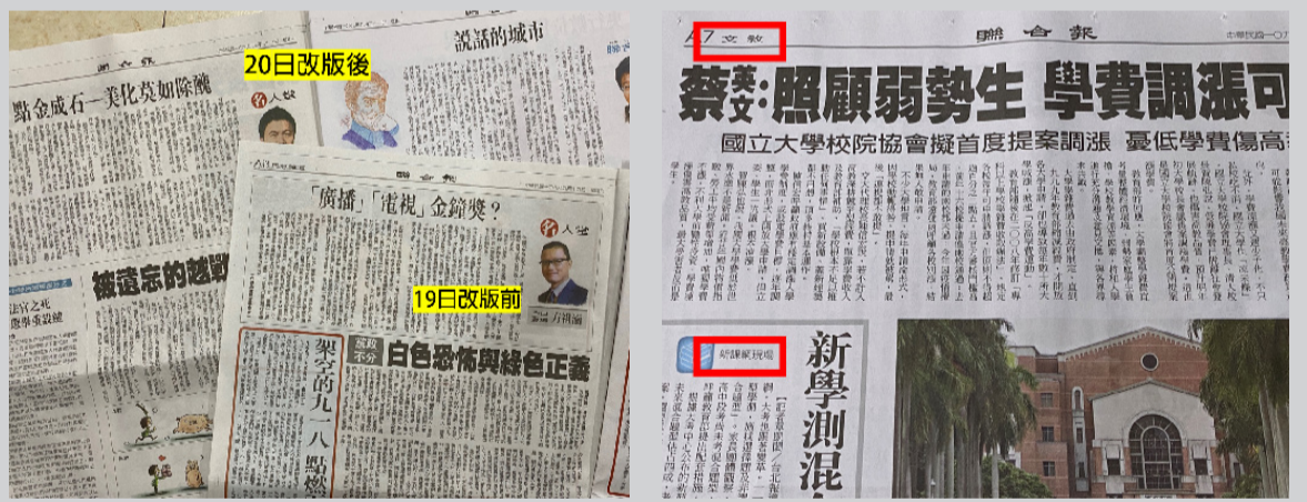
聯合報改版後，民意版改版為兩塊版(左)，文教版則開闢新課綱現場專欄。