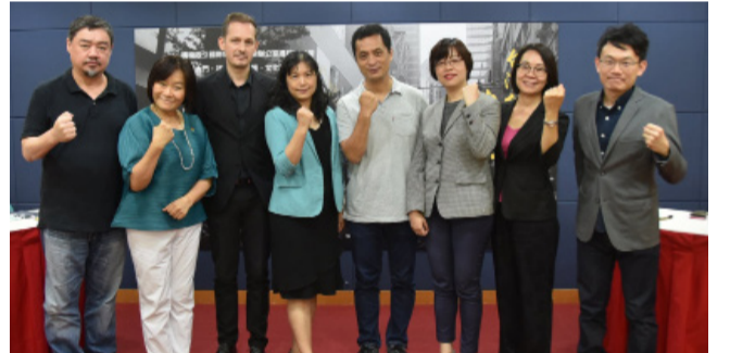
台灣撐香港倡議行動