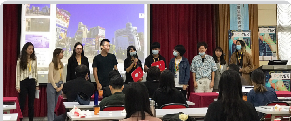
中央社舉辦的網路創作營，結業式以舞台劇的方式和台下長官與學生互動。