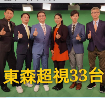
東森公布轉播團隊。

東森超視33台將於11月19日轉播HBL的預賽賽事，除了89場的HBL賽事，也會轉播109學年的高中壘球、排球、足球、啦啦隊錦標賽熱舞大賽及國中籃球、排球聯賽。