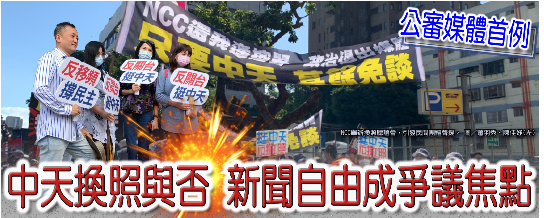
NCC舉辦換照聽證會，引發民間團體聲援。