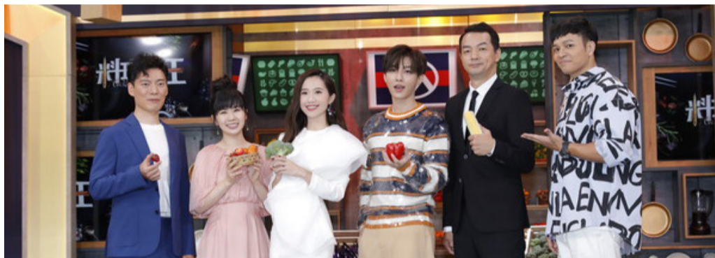
廚藝真人實境秀塊狀節目《料理之王》結合廚師網路社群經營打破媒介隔閡。