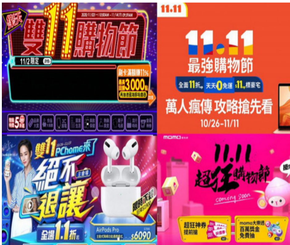
雙十一購物節各大電商及電信業者紛紛推出限時優惠。

遠傳旗下friDay購物3日起至15日全站推出多重消費回饋，包括限時抽這單免費、限時滿額抽iPhone 12以及11日當日限定筆筆回饋10%遠傳幣等活動。