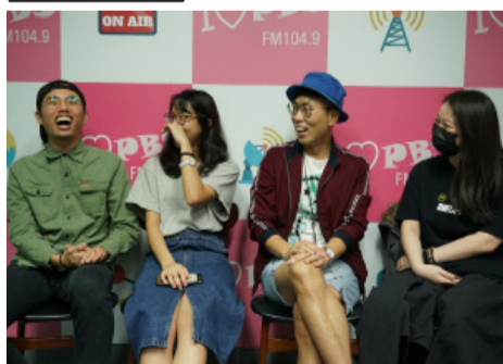
主持群在訪談過程中，言語字間透露出彼此真摯的情感，即使個性截然不同，感情卻相當融洽。