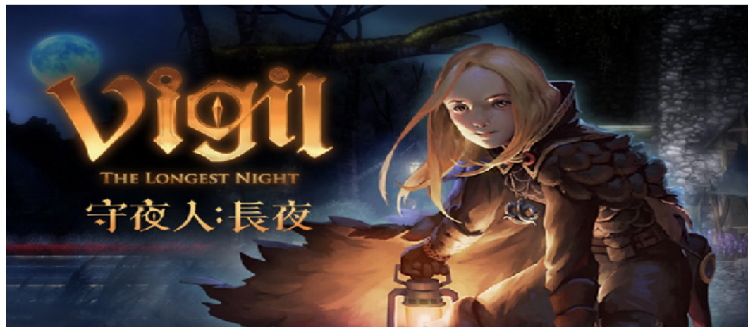
台灣獨立遊戲團隊玻璃心工作室開發的遊戲《守夜人:長夜》10月15日在Steam和Switch平台上架。

遊戲上市後反應熱烈，因此玻璃心工作室開啟專門的討論社團，對遊戲有興趣的民眾可以加入社團，回報問題、給予優化建議等。玻璃心工作室在臉書粉專表示，將持續規劃對於短期修復bug、長期持續優化遊戲體驗、調整地圖與流程等設計。