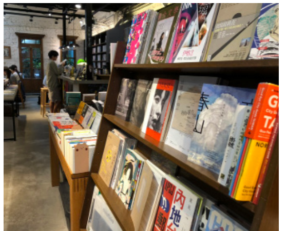
盼未來圖書產業能夠更加興盛。

趙政岷最後指出，讀者以新的工具、新的介面，改變閱讀方式。那同行間也許可以透過交流、學習，來因應不同於以往的閱讀環境。找出方法面對消費者，並建立新的出版生態，是下半年業者必須再去努力的。