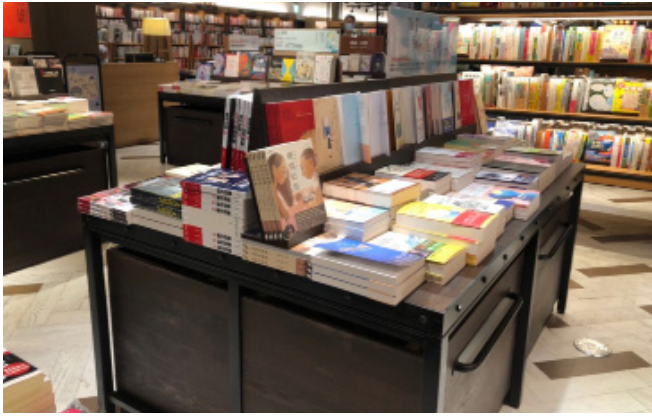
圖書免稅5%利益分配由業者自行調解。