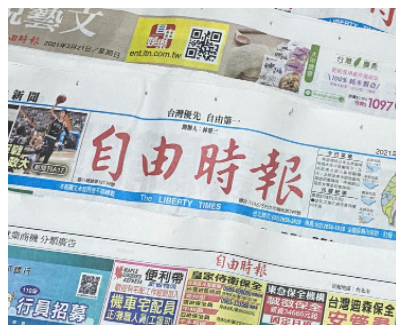
自由時報改版。