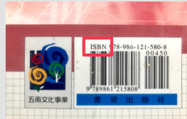
須具有ISBN、EISBN認證，才擁有申請圖書免稅的資格。