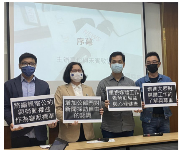
台灣新聞記者協會與台灣媒體觀察教育基金會4月21日發布媒體工作者受害報告。