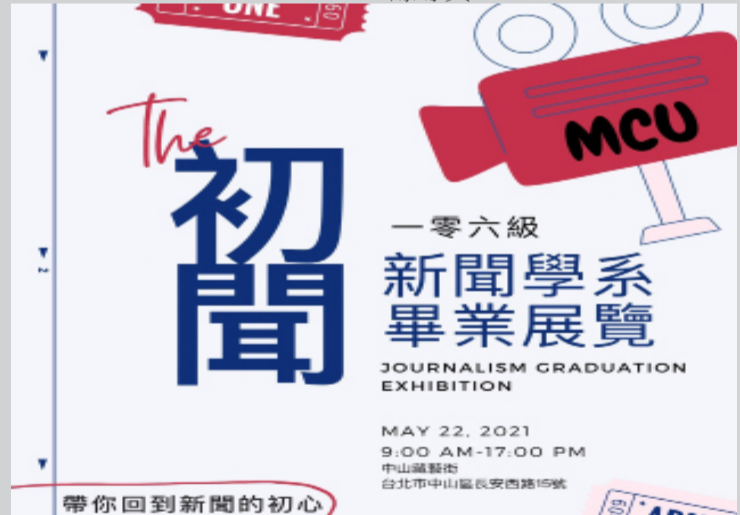
新聞系畢展《初聞》

銘傳大學新聞系畢業展覽《初聞》展覽資訊：時間110年5月22日上午9點至下午5點，地址台北市中山藏藝所(台北市中山區長安西路15號，近中山捷運站，中山地下街R4出口)，展覽的詳細資訊可關注《初聞》粉絲專頁。