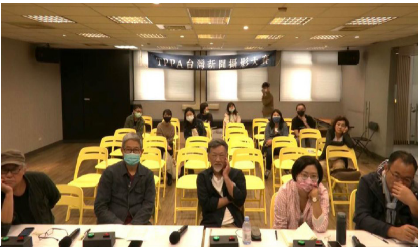
2021台灣新聞攝影大賽評選過程。