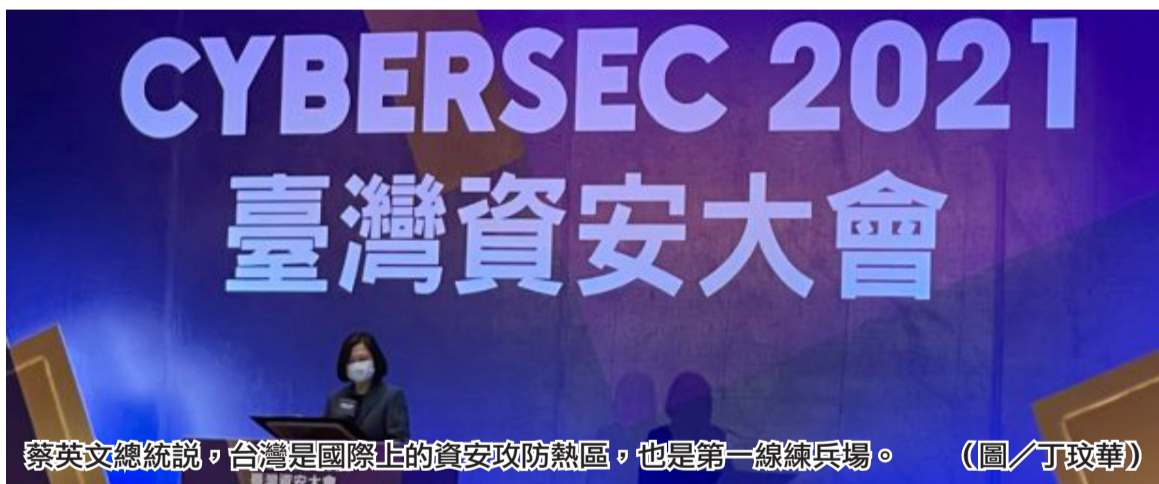
蔡英文總統說，台灣是國際上的資安攻防熱區，也是第一線練兵場。

台視新聞台發布新聞稿回應，台視公司人事編制超過660人，有343人為專屬人事編制，台視財經台則另有專屬編制，2個頻道節目規劃以及定位不同，並強調，台視新聞台去年節目自製率高達99.99%、新播加首播比例65.13%。