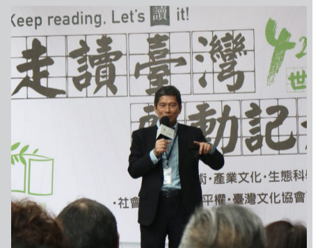
圖為文化部長李永得致詞。

此外，至5月24日止，文化部受理「走讀臺灣主題路徑建置計畫」民間單位徵件，邀全國各縣市之書店、出版單位及文史工作室共同策辦精選文本與特色路徑，讓民眾一整年都能閱「讀」臺灣原創出版品及實地「走」訪相關特色場域。