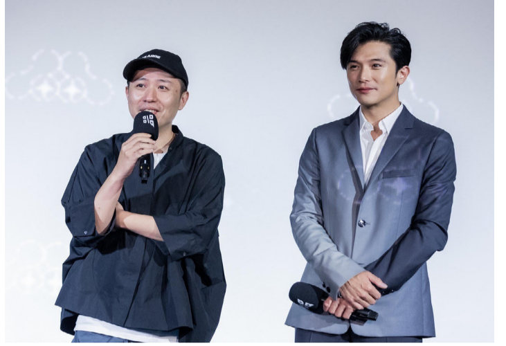
邱澤(右)擔任2021台北電影節影展大使，導演廖明毅(左)邀影迷走進戲院感受情感。

今年台北電影節6月24日至7月10日在臺北市中山堂、光點華山電影館、信義威秀影城、剝皮寮歷史街區盛大舉行，精采片單與活動即將陸續公布。