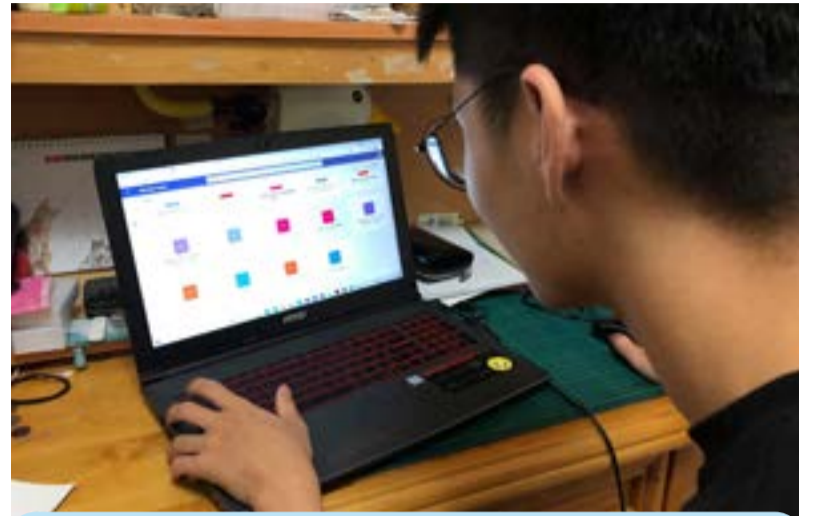
遠距上班上課，網路用量大增。

亞太電信表示，網路工程團隊24小時值班待命，確保用戶享有充足的國內聯外電路頻寬，同時進行流量監控及訊號調校，保持通訊品質順暢。