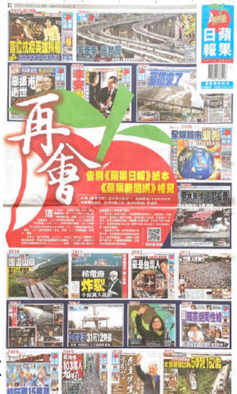
《蘋果日報》17日發行停刊紀念特刊。

最後，工會籲請資方善盡企業的社會責任，依法處理勞資關係，依《大量解僱勞工保護法》與工會展開協商，開放同事依自願資遣、考績等調整人力結構，否則工會將向勞動部提出不當勞動行為救濟。