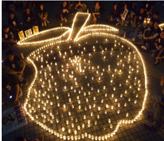
《蘋果日報》將資遣326名員工。