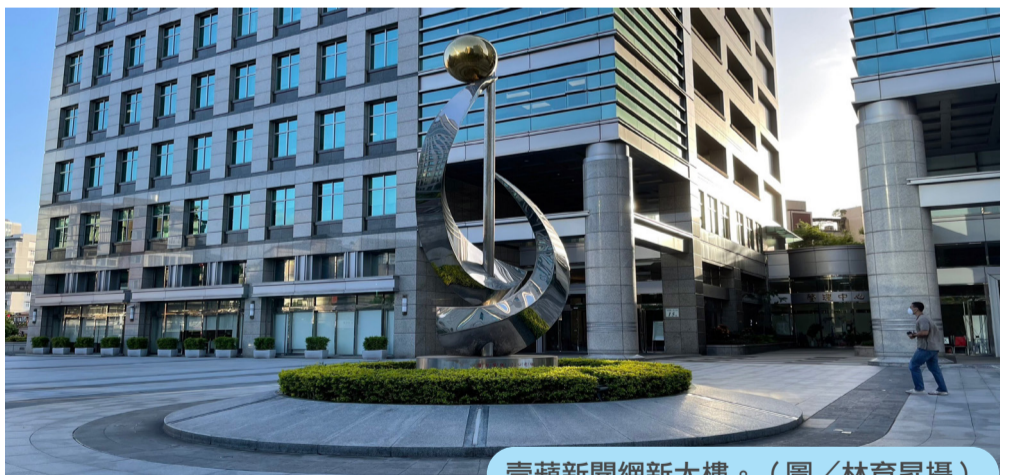
壹蘋新聞網新大樓。

目前使用設備上，攝影器材、電腦及影音設備等，原台蘋員工8月29日收到消息將這些設備全數交回香港蘋果日報，確定轉聘至《壹蘋新聞網》的員工則在8月31日，到內湖區指定地點領取電腦等設備，但軟體需要自行安裝。原本的辦公室也遷至文湖街辦公大樓。