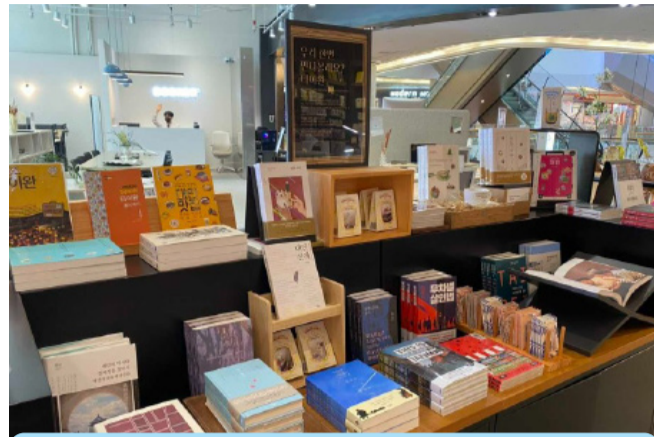
文策院於ARC N BOOK新村店舉辦臺灣出版品推介交流會活動，書店內陳設臺灣專區。

韓國Oomzicc出版社編輯長魯柔多表示，臺灣LGBT文化令人印象深刻，希望找到更多相關作品推薦給韓國的讀者；而韓國大型娛樂集團 CJ ENM的IP採購部門也有心儀的臺灣作品。文策院期待透過與業者的直接交流，更了解雙方市場的特性與需求，媒合更多優秀臺灣作品到海外市場。