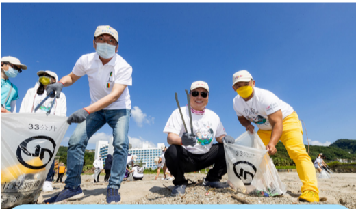
09/17東森國際淨灘日淨灘活動，圖左起為新北市副市長劉和然與東森總裁王令麟。

此外，東森也提到，自此次辦理淨灘活動後，集團目前規劃未來每年舉辦一場大型淨灘活動。節能減碳、熱愛家園，就從在地開始做起，日後倘若新北市在環境議題上需要任何幫助，東森隨時都能伸出援手，為新北市的土地和人民付出努力、為環境奉獻一份心力。