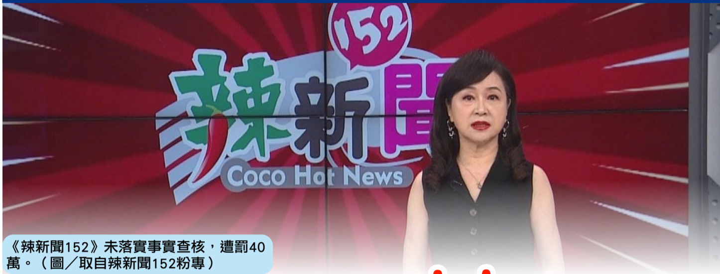
《辣新聞152》未落實事實查核，遭罰40萬。(圖/取自辣新聞152粉專)