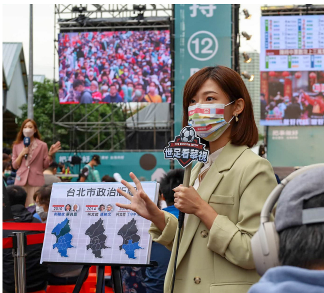
開票前，各家媒體紛紛於候選人競選總部現場連線