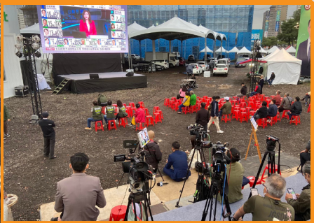
張善政競選總部吸引不少媒體錄影和直播。（左圖）支持者陸續到鄭運鵬競選總部現場等候結果，現場多家媒體準備直播報導。（右圖）