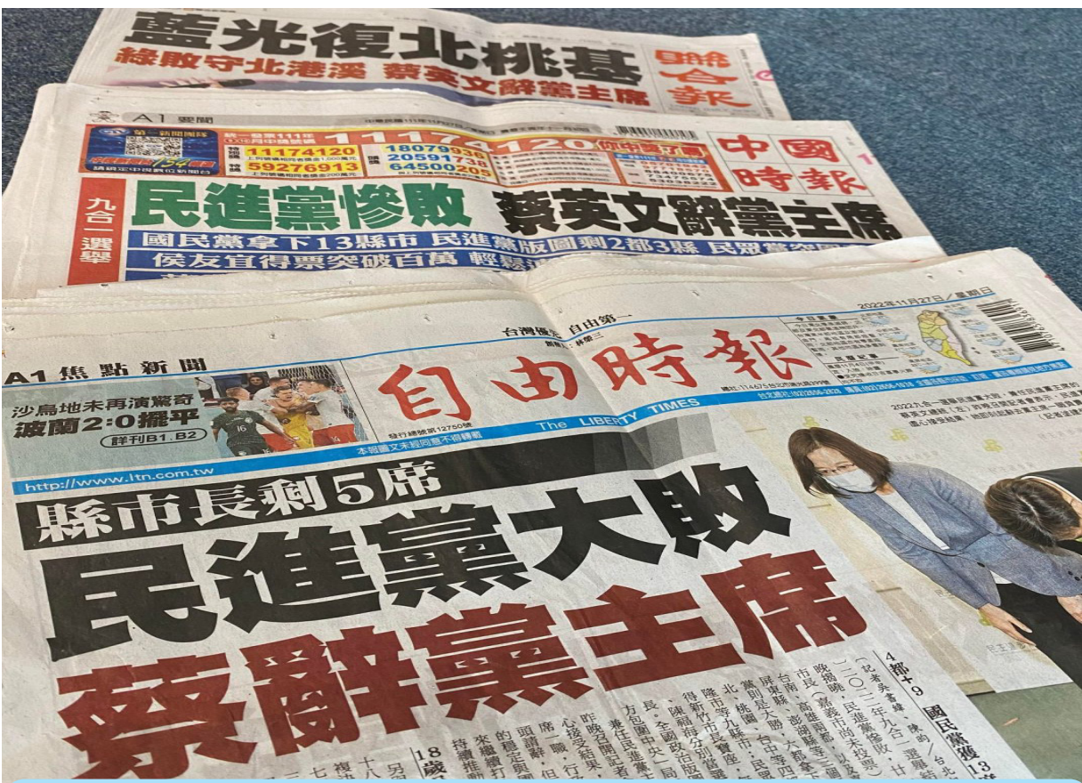
三大報頭版主題與主要關鍵字相同，紀錄選後歷史性的一刻。