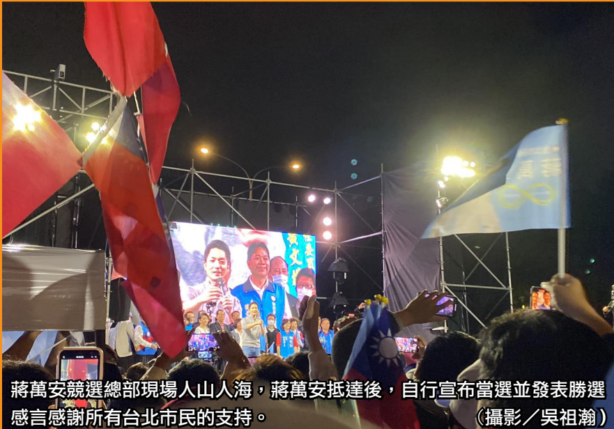
蔣萬安競選總部現場人山人海，蔣萬安抵達後，自行宣布當選並發表勝選感言感謝所有台北市民的支持。