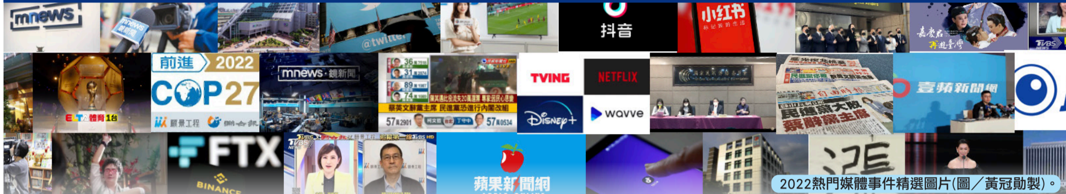
2022熱門媒體事件精選圖片(圖/黃冠勳製)。