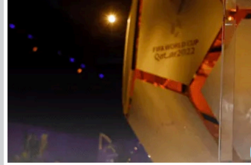
ELTA TV 官網世足轉播資訊圖