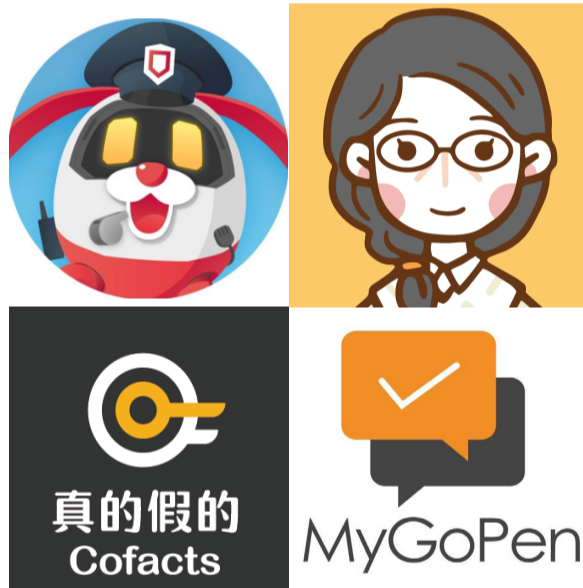
台灣最多人使用的AI假訊息判斷機器人前四名，分別為防詐達人、美玉姨、Cofacts真的假的及Mygopen。