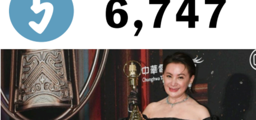
陳亞蘭於金鐘 57 奪下視帝

藝人陳亞蘭在第57屆金鐘獎以電視劇《嘉慶君遊臺灣》扮演皇帝嘉慶君一角成首位女扮男裝的金鐘最佳男主角得主，創「女視帝」首例，不僅代表金鐘獎突破性別的限制，也展現出台灣的多元、進步及包容，是性別議題上的大進步。