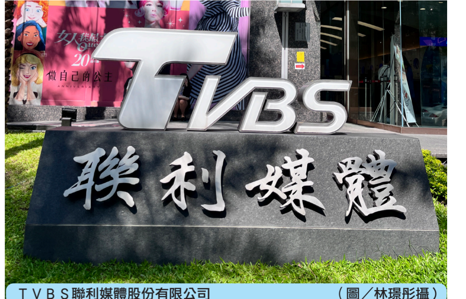
TVBS聯利媒體股份有限公司

數位發展部在12月邀集Google、Meta與台灣廣電媒體、平面媒體舉辦四場媒體議價會議，數位發展部部長唐鳳指出，會儘快彙整四場對話共識，交由行政院跨部會會議討論，但具體時間仍未定案。法律、新聞學者建議，國內媒體應該統整媒體訴求，才能與政府部門、平台業者進行有效溝通協商，公部門也應推動立法，建立平台分潤機制，要有更清楚地進程規畫。