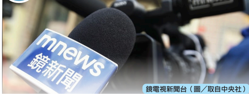
鏡電視新聞台