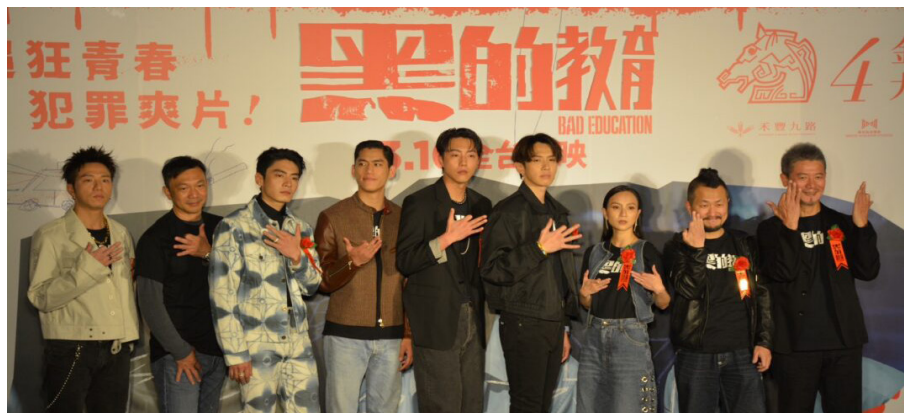
左起為演員大飛、黃信堯、宋柏瑋、朱軒洋、蔡凡熙、導演柯震東、演員張甯與監製九把刀、柯耀宗。