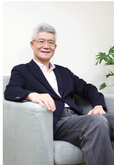
公廣集團董事長胡元輝。