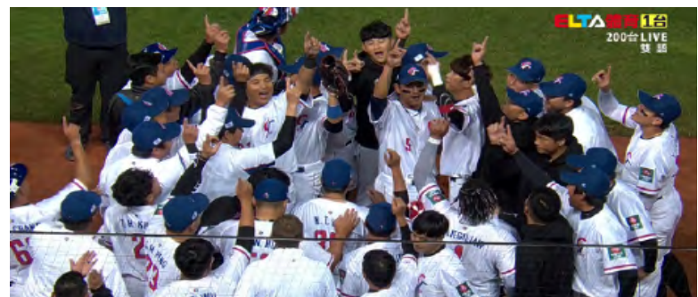
8日晚間8點，MOD愛爾達電視轉播飆出4.17收視率，首日收視率即開出紅盤。