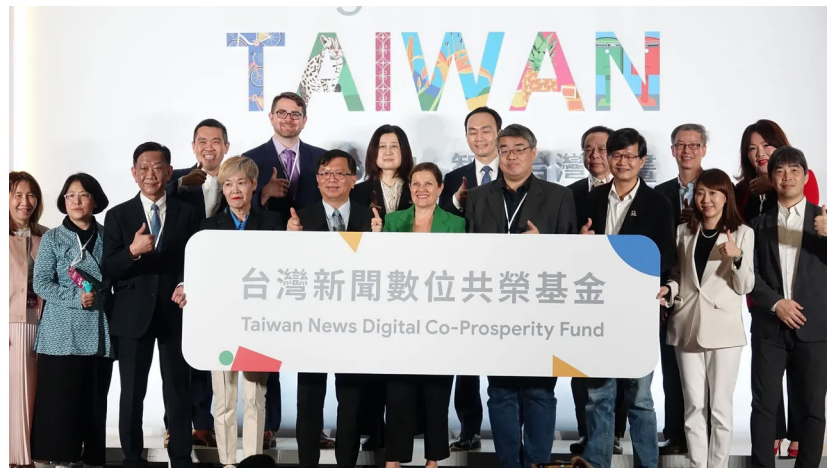
Google推出新聞數位共榮基金。

兩大電視媒體公學會提到，數位平台演算法控制流量，導致媒體必須迎合演算法產製內容，極度不利於新聞媒體的專業自主，期盼數位平台優先進行共榮措施，提供一定金額的費用，優化、良性化的推薦以及分潤權重，讓演算法也能產生質化的價值。