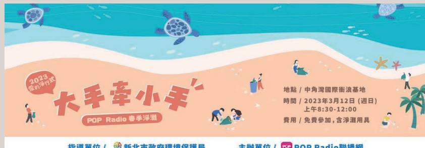
POP Radio舉辦親子能一同參與、學習環境保護知識的淨灘活動。

目前預計6月20日前公告入圍名單，頒獎典禮暫定8月26日於國立臺灣藝術教育館南海劇場舉辦，教育電台表示，金聲獎已3年沒有舉辦實體頒獎典禮，今年期待能夠舉辦實體頒獎典禮，並且將視疫情狀況決定續辦、停辦、延期或改線上典禮，相關訊息公布入圍名單時一併公告周知，金聲獎活動簡章及報名訊息請至教育電臺「金聲獎專區」下載查詢。