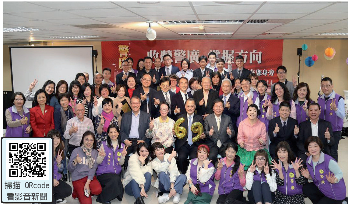
警政署長黃明昭希望警廣能更加深化反詐騙宣導，並祝警廣69歲生日快樂。