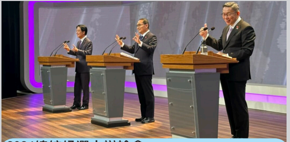
2024總統候選人辯論會。

外媒申請採訪部分，中東地區通訊社Viory首度加入，日本主流大媒體也都參與，另有美聯社、路透社、BBC、NHK、VOA、RFA等等。