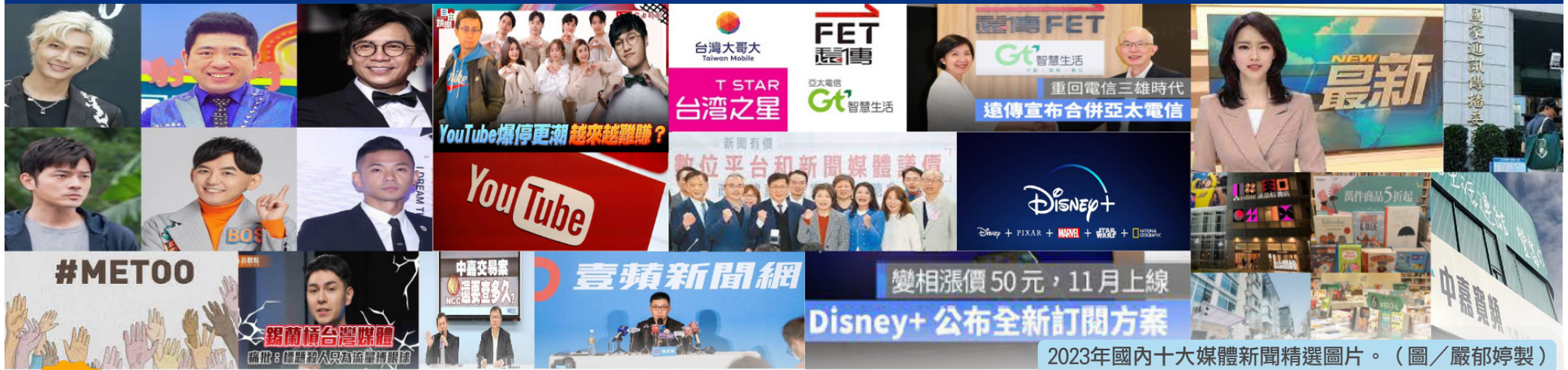
2023年國內十大媒體新聞精選圖片。

第2039號 總號第2239號 採訪中心、行政中心 / 28824564轉2413 1982年11月1日校內創刊 1989年11月1日登記出版