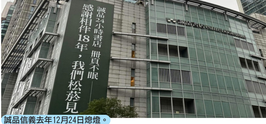
誠品信義去年12月24日熄燈。

整理報導/王宜柔 誠品於去年1月3日宣布，因房東確認收回房屋，誠品信義店將營運至12月24日為止。而誠品信義店的24小時不打烊模式將於2024年1月20日由誠品松菸3樓書店接棒，期間營運空檔則由誠品南西5樓書店以連續28天不打烊的方式承接24H營運模式。信義誠品在24日也舉辦「不見不散音樂會」，邀請多位音樂人演出，與民眾一起倒數信義誠品熄燈的瞬間，周末兩日共吸引15萬以上人潮前往，突破歷史紀錄。而將接棒24小時書店的「誠品松菸店」，目前正在分區改裝中，圖書總量將擴大3倍，有意打造相當於「誠品敦南店」的規模，並結合誠品畫廊、電影院、表演廳、黑膠音樂等，誠品指出，松菸店將會是全球獨一無二、營運範疇最完整豐富的實體文化場域，持續陪伴讀者。