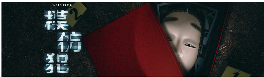
Netflix台劇《模仿犯》獲網友高票支持。

13日即將為總統選舉日，選戰議題也成為台劇新寵，《人選之人 造浪者》開播前即因涉及政治敏感題材引起廣泛關注，成功入榜。另外，Disney+原創台劇《台灣犯罪故事》因改編自真實犯罪案件，並引入好萊塢的製作模式，而吸引熱烈關注。